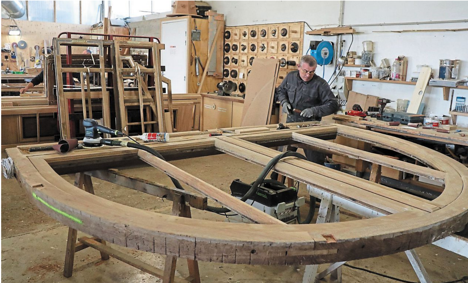
L'entreprise Asselin, de Thouars (Deux-Sèvres), a rénové les huisseries et ouvrants du château de Villers-Cotterêts (Aisne).

« C'est un morceau de bravoure. On ne peut que s'incliner. Ce sera splendide. »