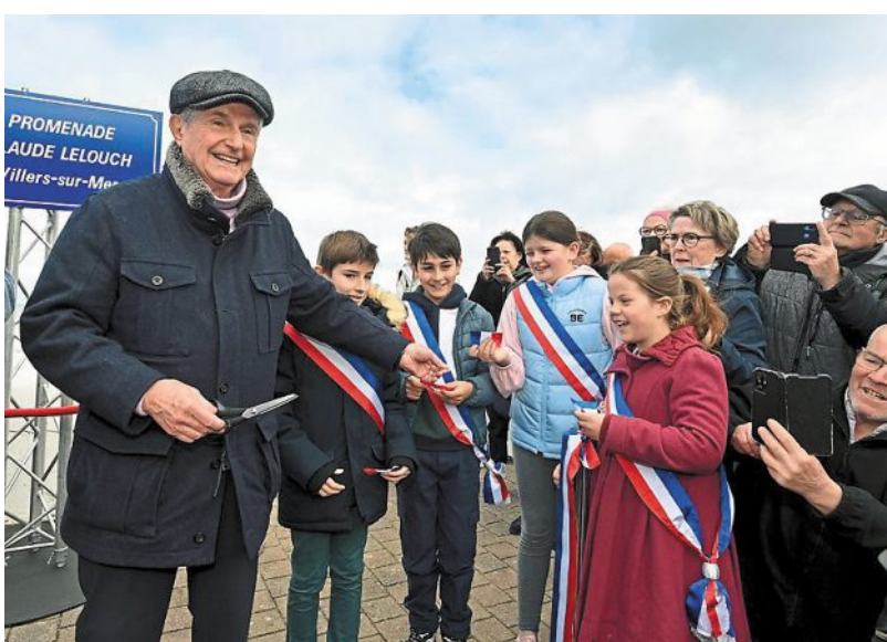
Claude Lelouch était à Villers-sur-Mer (Calvados), hier, pour l'inauguration de la promenade en front de mer qui porte désormais son nom.

Quand il retrouve ce littoral qu'il connaît si bien, l'insatiable cinéaste ne fait pas que s'y balader. Il y pose aussi sa caméra. Sur la cinquantaine de longs-métrages qui composent sa fil-